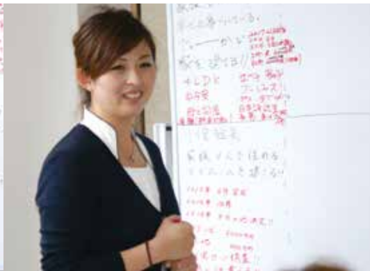
▲スタッフの皆さまの研修風景