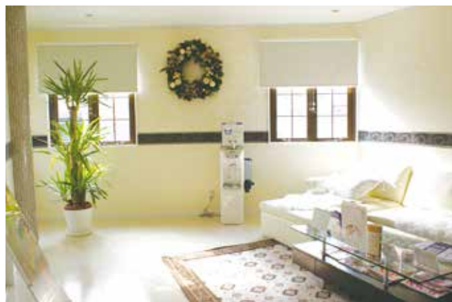
▲ビューティースパ・シュプリーム様「店内」

アルフォサポートはビューティースパシュプリーム様の販売促進を総合的にサポートさせていただきます。