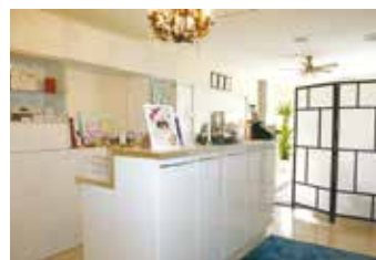
▲ビューティースパ・シュプリーム様「受付」

さらに、ビューティースパシュプリーム様のブランドを充分表現できるよう、店舗内外の空間デザインをご提案させていただきます。